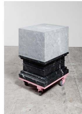
Shahryar Nashat Mother on Wheels (Nero Marquina 2), 2016 Marmor, pulverbeschichteter Stahl, Rollen 88 × 58 × 48 cm Courtesy der Künstler und RODEO, London/Piraeus