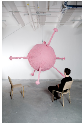
Franz West Epiphanie an Stühlen, 2011 Skulptur: Stahl, PU-Schaum, Gaze, Dispersion Stühle: Stahl, Holz, Bambus, Leinen Installation, variable Maße