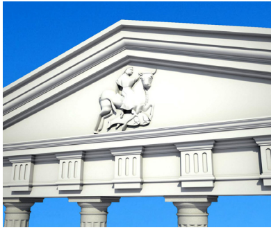
Tempel der Europa Graz, 2021