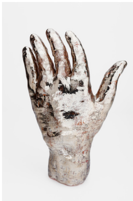
Barbara Kapusta Leaking Body, 2020 Rotlehm, transparente Glasur, Platin Glanz 34 × 22,5 × 10,5 cm